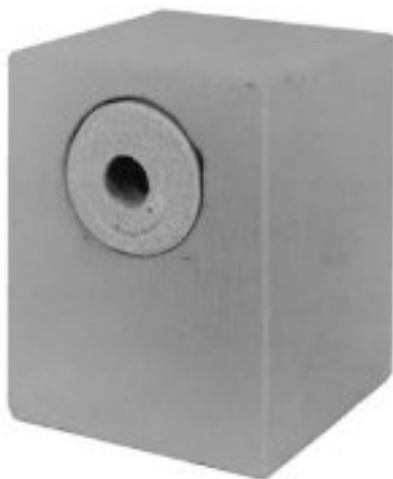
Nichoir à encastrer.