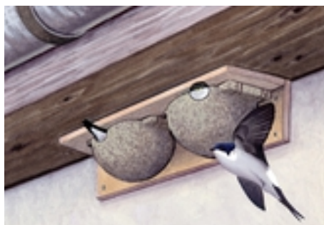
Nids à hirondelles de fenêtre.