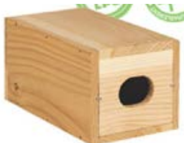
Nichoir à Martinet noir.