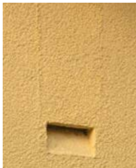
Nichoir à chauve-souris.