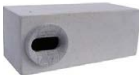
Nichoir à encastrer.