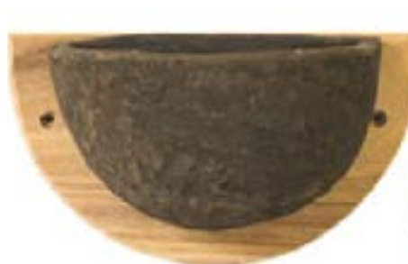
Nids à hirondelles rustique.