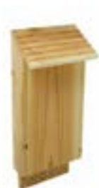
Nichoir à Chauve-souris.