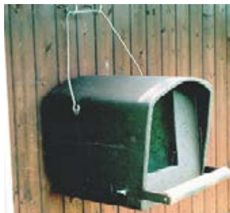
Nichoir à Faucon crécerelle.